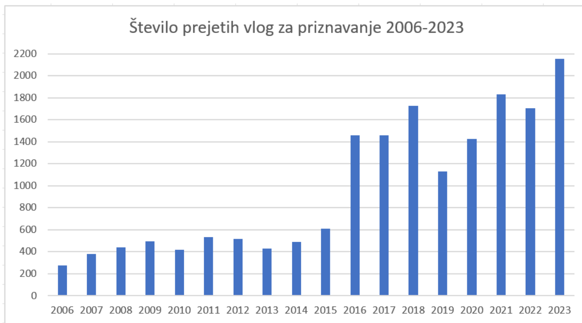
Preglednica 4: Grafični prikaz števila prejetih vlog za priznavanje po letih

Število prejetih vlog za priznavanje izobraževanja za namen nadaljevanja izobraževanja se je v letu 2023 glede na prejšnja leta povečalo (preglednica 3), kar smo pričakovali, glede na že navedeno spremembo Pravilnika o obrazcih, dokumentaciji in stroških pri vrednotenju in priznavanju izobraževanja , po kateri kandidatom ni treba več pošiljati originalnih zaključnih srednješolskih listin. Zlasti olajšani so postopki pri listinah iz držav, kjer imajo urejene enotne digitalne baze podatkov izdanih spričeval o doseženi izobrazbi na ravni države. Preverjanje znanja je centralizirano in ga izvajajo za to pristojne in pooblašene ustanove na ravni pokrajin ali države. Ti vnašajo rezultate letnih preverjanj v bazo (npr. Bangladeš, Ukrajina). Ker so postopki priznavanja za te države s tem poenostavljeni, je izkazano bistveno povečanje števila vlog kandidatov, ki so zaključili izobraževanje v teh državah. Z nadaljevanjem digitalizacije lahko pričakujemo večji porast vlog tudi v prihodnje.