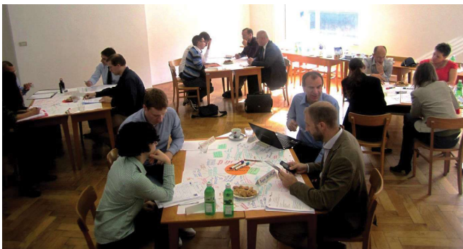
► Prvi posvetovalni obisk na UL TEOF

Z uporabo sodelovalnih metod (pri tem pristopu in širše) smo vplivali na odnos do spremljanja kakovosti. Na ses-tankih s članicami UL smo se soočali s precej odklonilnim